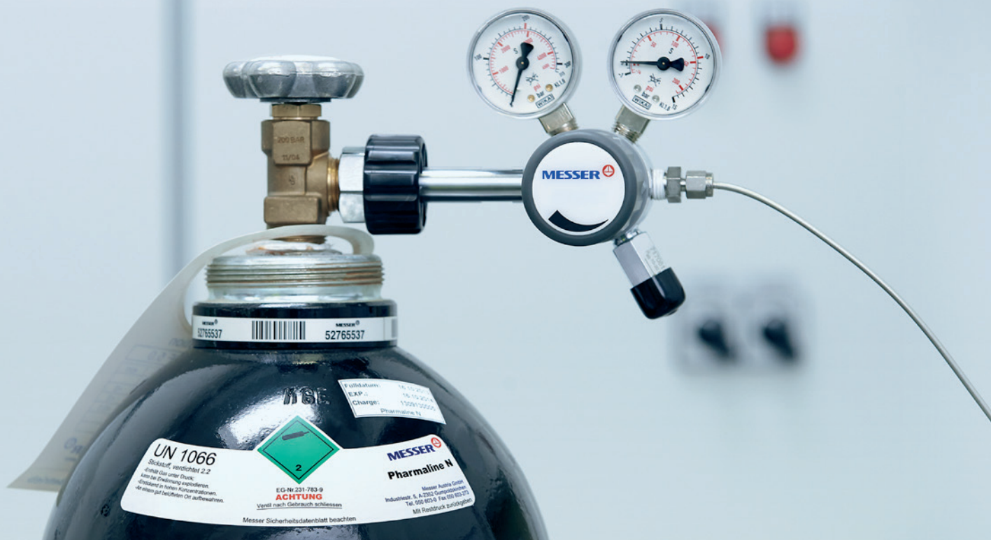
Botella individual en el punto de uso con regulador de presión