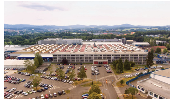
Obr. 1 - Výrobní závod Magna Exteriors (Bohemia) Liberec

Pokud zatím ne, nevadí! Omlouvá vás, že vzhledem k historii všech dostupných stávajících metod čištění lze tuto aplikaci považovat za relativně novou. Věříme ovšem, že se v následujícím příspěvku dozvíte více. Čistícím médiem je v tomto případě suchý sníh vytvořený z kapalného oxidu uhličitého. Tato neabrazivní čistící metoda je velmi rychlá, pro dané použití velmi účinná, ale především ekologicky nezávadná a použitelná přímo v provozu lakovny. Velkou výhodou je celková automatizace procesu bez vlivu lidského faktoru. Messer v Čechách i v zahraničí spolupracuje s německou společností Mycon, která nabízí komplexní služby od výroby ručních i automatických variant technologie IceMaster. Publikace popisuje zkušenosti z implementace této aplikace u jednoho z nejvýznamnějších výrobců technicky náročných dílů z plastů na českém trhu, společnosti Magna Exteriors (Bohemia) s.r.o. Liberec, www.magnabohemia.cz (dále jen Magna), která je dlouholetým partnerem mnoha firem a to nejen z oblasti automobilového průmyslu [obr. 1].