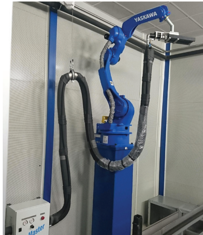
Obr. 2 - Implementace IceMaster do lakovací linky

Čištění suchým sněhem je efektivní a ekonomický postup pro odstranění zbytků z výroby, uvolnění chemických látek a nečistot. Čištění sněhem je podobné procesu tryskání peletami suchého ledu, s tím rozdílem, že malé částice CO 2 -sněhu s teplotou -78,5 °C se získávají v průběhu čištění uvolněním tlaku kapalného CO 2 . K takto uvolněným částicím CO 2 je proporcionálně přidáván stlačený vzduch, který akceleruje tyto drobné částice sněhu na výstupu ze speciální ploché trysky. Jejich čistící účinek způsobují tři základní faktory: kinetická energie, efekt tepelného šoku a sublimační efekt. Automatizace provozu čištění suchým sněhem LCO 2 vyžaduje trvalý přísun kapalného oxidu uhličitého o tlaku 40-60 bar, umístění čistící hlavice s tryskou na robot [obr. 2], zvukově izolovaný čistící box včetně odsávání a stlačený vzduch o tlaku 1-2 bary a průtoku 1,5-2,5 m 3 /min. Kapalným oxidu uhličitého je skladován v tlakových lahvích, přepravních odpařovacích stanicích nebo kryogenních zásobnících [obr. 3].