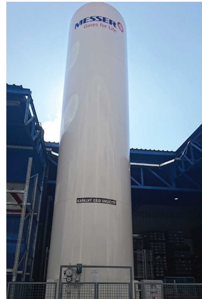
Obr. 3 - Kryogenní zásobník pro skladování kapalného oxidu uhličitého

V první řadě je to automatizace procesu. Aplikace je umístěna na robotech Yaskawa v klimatizované kabině se stabilními parametry – teplota, vlhkost a průtok vzduchu. Proces čištění se tím stabilizoval. Robot s aplikační tryskou pracuje 24 hodin denně a 5 dní v týdnu se stejnými parametry a vždy jede po stejných drahách. Z velké části jsme eliminovali základní nestabilitu – vliv lidského faktoru. Dosáhli jsme snížení zmetkovitosti o 1-1,5%. Technologii používáme nyní na ca. 40% výroby a stále se pracuje na programech robotů pro další díly. Operátoři se mohou více věnovat procesům, kde automatika selhává – navěšování, svěšování a kontrola dílů.