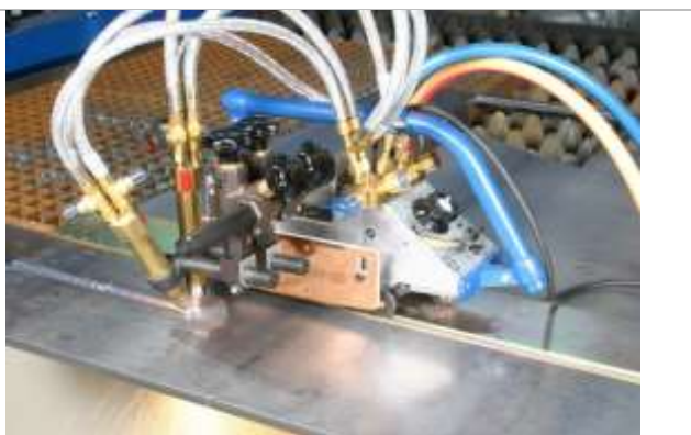
S dvoma strojnými rezacími horákmi