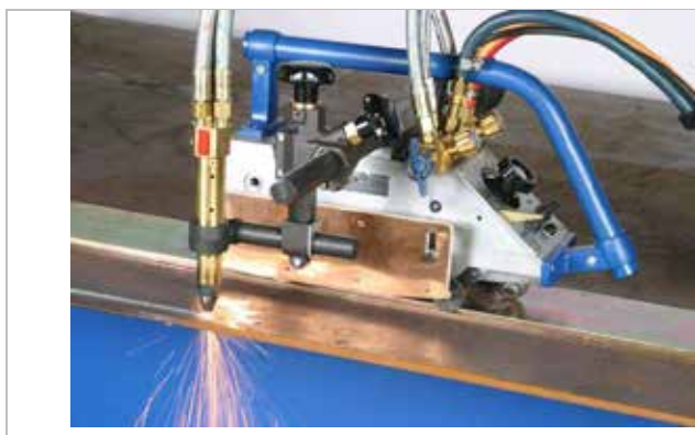
S jedným strojným rezacím horákom