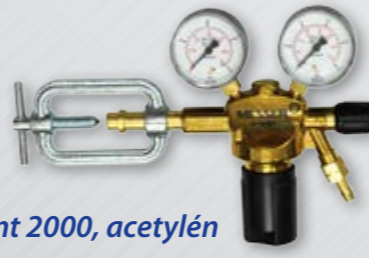
Constant 2000, acetylén