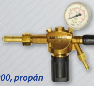
Constant 2000, propán