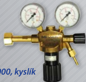
Constant 2000, kyslík