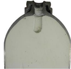
Schnitt einer C 2 H 2 -Flasche

Trotz des oben erwähnten Sicherheitssystems kann es unter ungünstigen Umständen zu einer Zerfallsreaktion im Flascheninnern kommen.