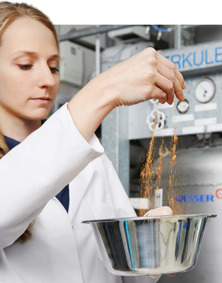
Mit dem Kaltmahlen wird ein Verschmelzen und Verkleben des Mahlguts ausgeschlossen. Gewürze behalten ihre Aromen.