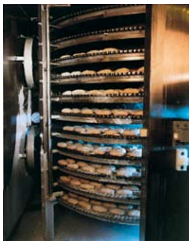
Zamrażarka z taśmą spiralną Cryogen®-Rapid

Nowe trendy konsumenckie wymagają od producentów utrzymania stabilnej, wysokiej jakości produktów. Dlatego właśnie wszystkie rozwiązania technologiczne firmy MESSER uwzględniają specyfikę zarówno małych, jak i średnich zakładów produkcyjnych. Stanowi to często rozstrzygający argument przy wyborze dostawcy urządzeń i technologii.