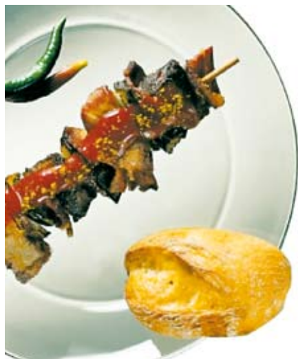
Chłodzenie potraw w procesie „Snow Blizzard”

W procesie tym w kontrolowany sposób następuje wymiana ciepła między produktem a przepływającym gazem chłodzącym. Proces ten nadaje się do obróbki poszczególnych, wyrobów przeznaczonych do schładzania i wstępnego zamrażania np.: rogalików z ciasta francuskiego, obwarzanków, kanapek, bagietek, ciast i tortów.