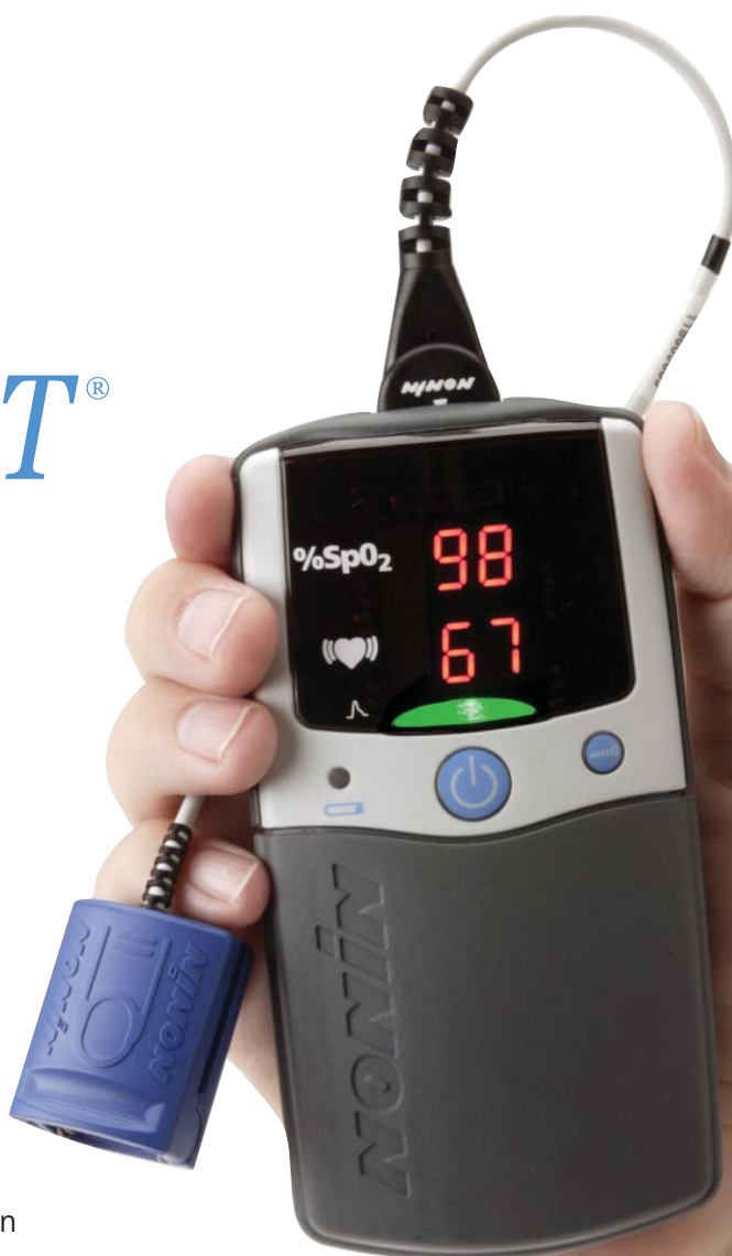
PalmSAT 2500 mit Fingerklemmsensor 8000AA

PalmSAT® – Die nächste Generation von Hand-Pulsoximetriegegeräten – umfasst kleine, vielseitige digitale Pulsoximeter, die für eine genaue Erfassung der Sauerstoffsättigung und Pulsfrequenz konzipiert sind. Ihre kompakte Größe, einfache Bedienung und außerordentlich lange Batterielebenszeit sowie die Verfügbarkeit von Modellen mit und ohne Alarm machen die PalmSAT Serie 2500 zur idealen Lösung für die Erfüllung des ambulanten Überwachungsbedarfs, unabhängig vom Standort des Patienten.