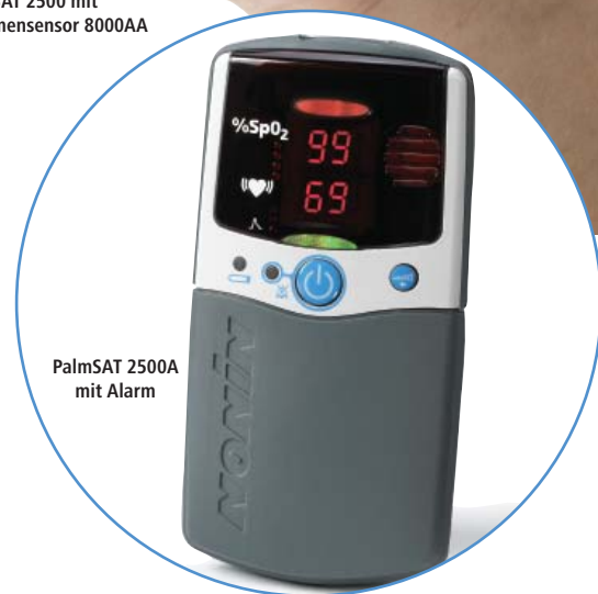
PalmSAT 2500A mit Alarm