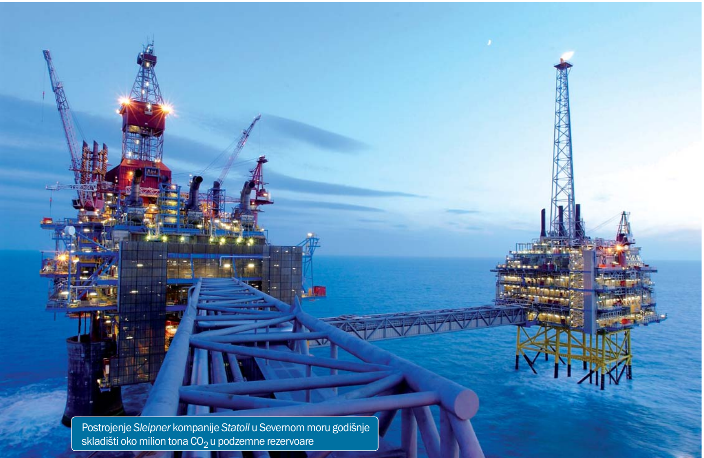
Postrojenje Sleipner kompanije Statoil u Severnom moru godišnje skladišti oko milion tona CO 2 u podzemne rezervoare

Skladištenje ugljendioksida kao tečnosti i hidrata je novija metoda geološke sekvencije ugljendioksida iz otpadnih gasova. CO 2 bi se ubrizgavao ispražnjene/iscrpjene rezervoare i/ili akvarijume, koristeći pri tome sličnu infrastrukturu koja se koristi na nalazištu gasa Sleipner u Severnom moru, ali bi se ubrizgavanje