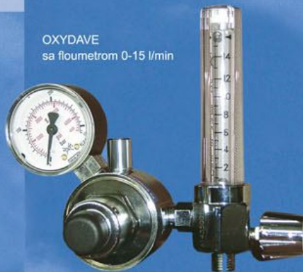
OXYDAVE sa floumetrom 0-15 l/min