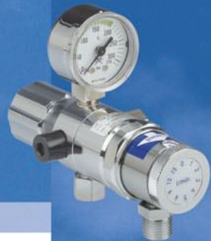
FM 42 sa blendom 0-15 l/min